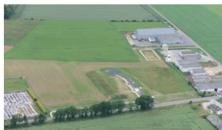
Vues aériennes du parc d'activités de Bann Er Lann