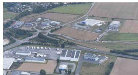
Vues aériennes du parc d'activités de Lann Velin Sud